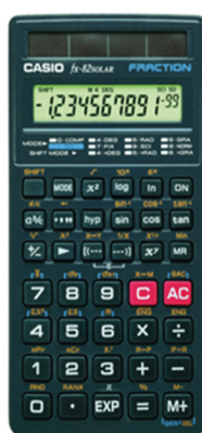
Casio FX – 82 Solar