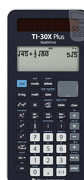
TI-30x Plus MathPrint