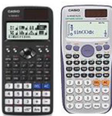
Casio FX – 991