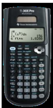
TI – 30X Pro