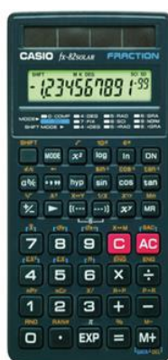
Casio FX – 82 Solar