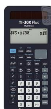
TI-30x Plus MathPrint